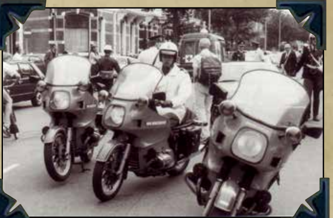
IPA Jubileum 60