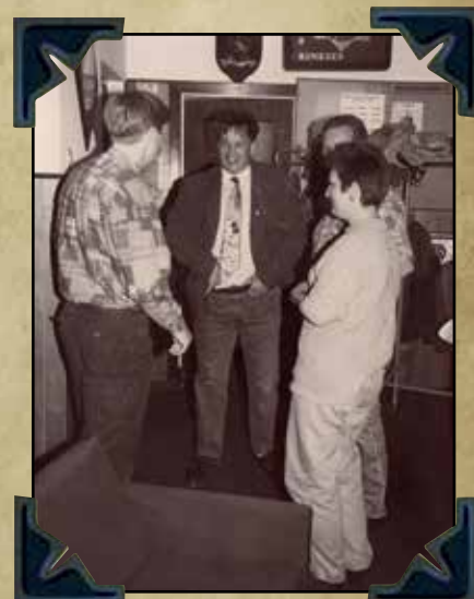
IPA Nmg bijeenkomst Paardenstal