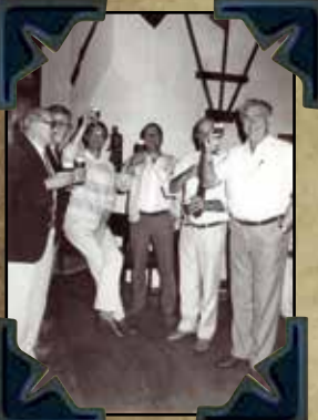
IPA Nmg bestuur in Gimborn