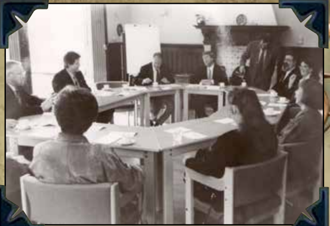
HB IPA Nederland - bestuursvergadering.