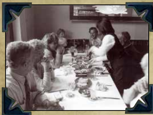
het kon niet op...