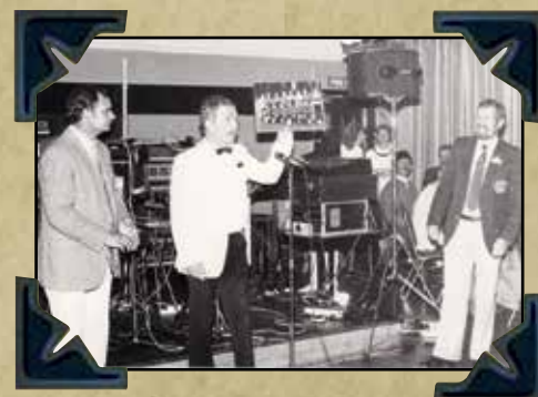
IPA Nmg prijsuitreiking Voetbaltoernooi