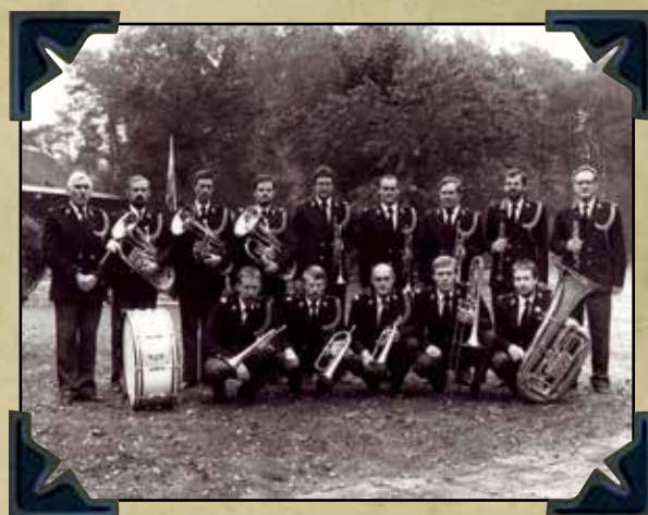
TirolerKapel van de RP