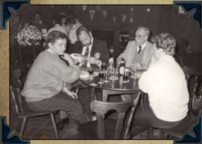
IPA Jubileum 60