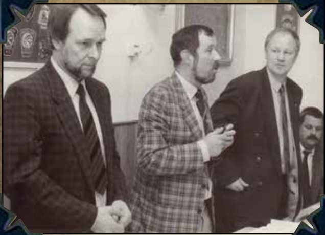
HB leden IPA Ned