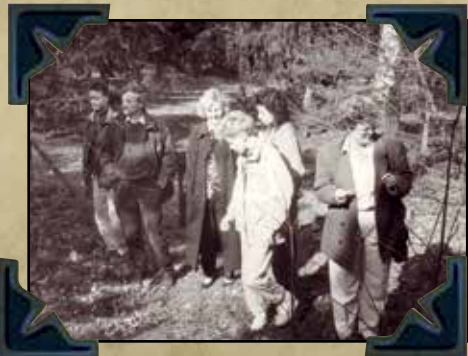
IPA Nmg Natuurwandeling